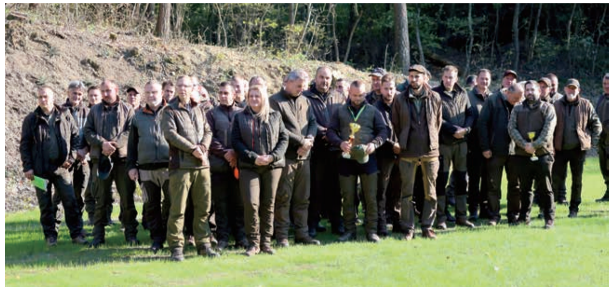
A lőverseny résztvevő hasznos tapasztalatokat szereztek

Köszönjük a kollégák részvételét. Gratulálunk a helyezettnek!