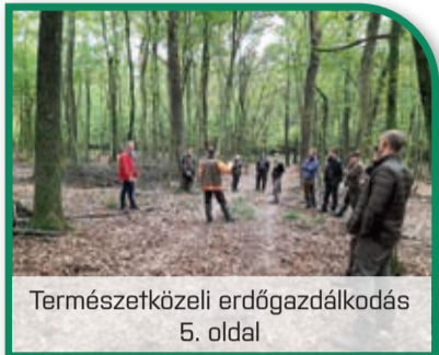
Természetközeli erdőgazdálkodás 5. oldal