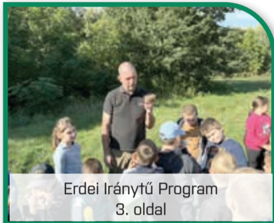
Erdei Iránytű Program 3. oldal