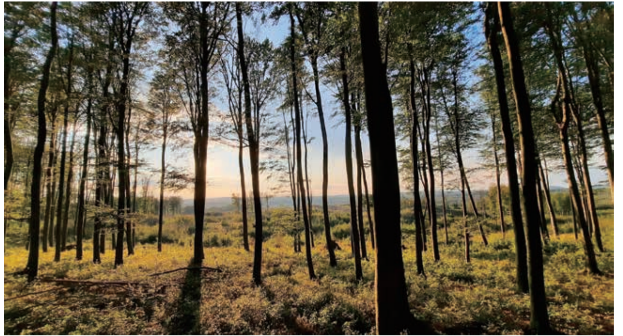
Illusztráció fotó: Gergél-Gombási Mónika

A kezdeményezés az Európai Unió emissziókereskedelmi rendszerének (ETS) kvótafelhasználásából, az Energiaügyi Minisztérium támogatásával, az Agrárminisztérium közreműködésével és az Országos Erdészeti Egyesület koordinálásában, a Magyar Máltai Szeretetszolgálat Iskola Alapítványával együttműködve valósul meg. Az Agrárminisztérium szándéka szerint a program 2026-ban is folytatódik.