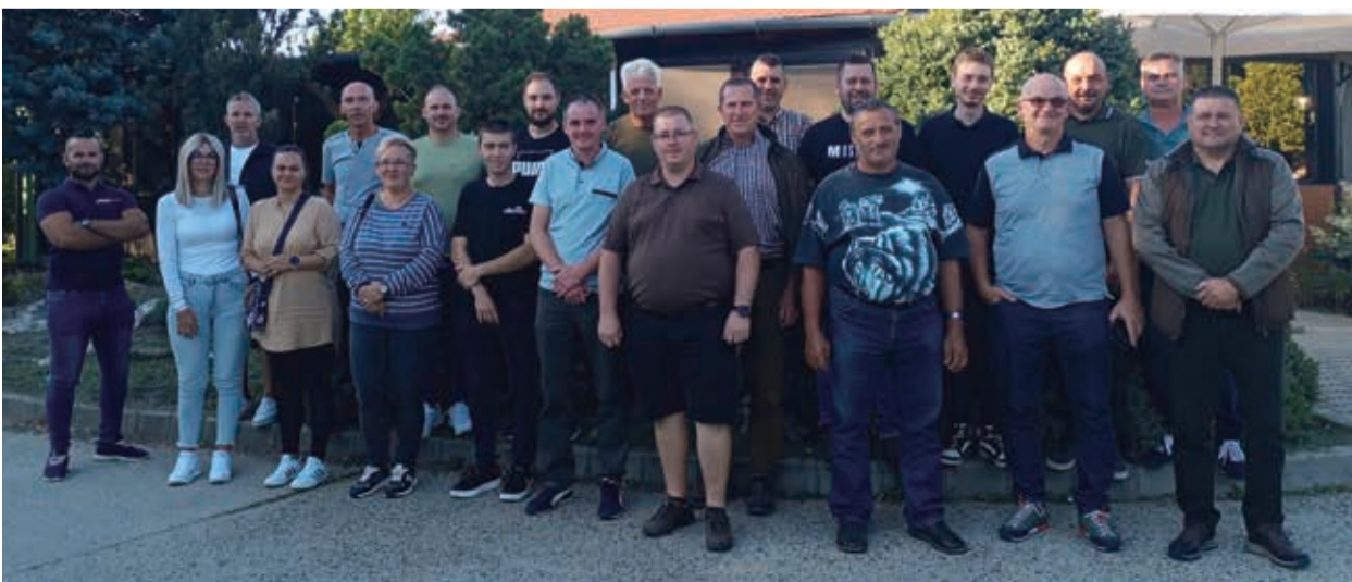
Fotó és szöveg: Farkasgyepűi Erdészet

A kirándulás betöltötte a közösség-építő funkcióját: a résztvevők a megszokott környezetből kiszakadva, kötetlen és oldott légkörben erősítették a csapatszellemet, fejlesztve ezzel a belső kommunikációt, és jobban megismerhették egymást.