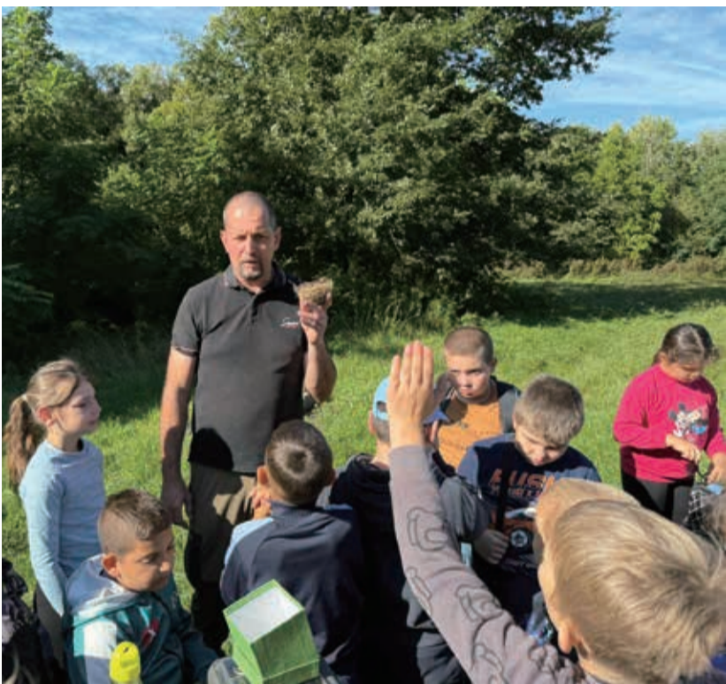
Célunk a jövő szempontjából létfontosságú fenntarthatósági és környezettudatos értékek átadása

A Zalaszentgróti Koncz Dezső Általános Iskola és EGYMI kisdíkjai a