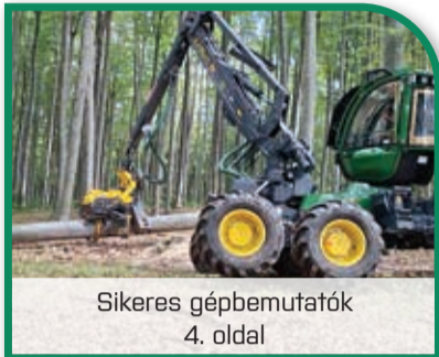
Sikeres gépbemutatók 4. oldal