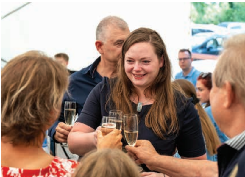
Nagyon sokan gratuláltak az olimpiai bronzérmesnek

– Nehéz olimpiai ciklusom volt, végig kellett versenyeznem a szezon