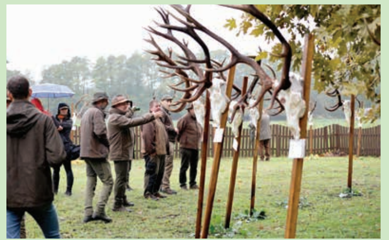
Jó hangulatú trófeamustra az esős, hűvösebb időjárás ellenére