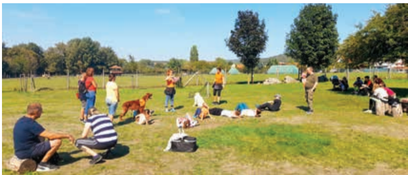
Idén már hatodszor lehetett ellátogatni a családi programra