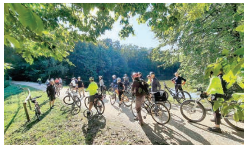
A bringások a bakonyi Gyilkos-tónál. Csodás környezetben tekerhettek