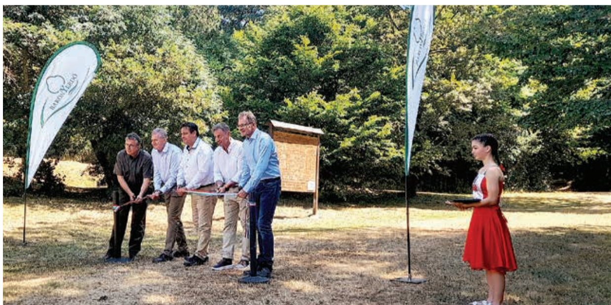
A Balatonnál nyílt a tizenkettedik egészségmegőrző és rehabilitációs célú túraösvény

A túra során kijelölt ellenőrzőpontokon pulzuszámra szólítanak fel, a mért egészségügyi adatokat pedig utólag egészségügyi szakemberek értékelik ki. Azok számára, akiknél el-