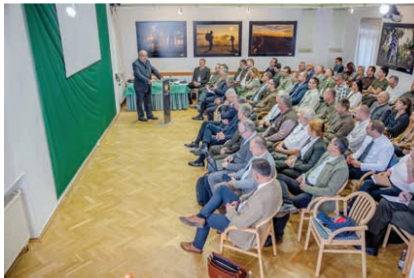
Zambó Péter erdőkért felelős államtitkár nyitotta meg a konferenciát

gázok kibocsátásának és abszorpciójának 2030-ig való megfelelés lehetséges irányairól beszélt. Klímapolitika az Európai Unóban és annak várható hatásai az erdőgazdálkodásra téma-