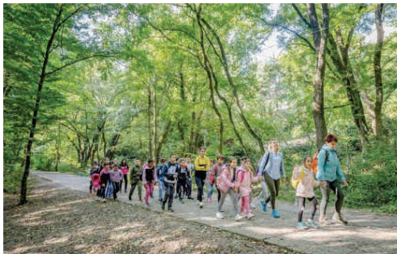
Két hónap alatt 3000 hátrányos helyzetű tanuló vett részt rendhagyó természetismereti órákon

Több minisztérium és szervezet együttműködésében megvalósuló program finanszírozója az energiaügyi tárca, amely a szén-dioxid-kvóta keretből 300 millió forinttal támogatja a kezdeményezést. Szakmai háttérét az agrártárca adja, koordinációját pedig az Országos Erdészeti Egyesület végzi a Magyar Máltai Szeretetszolgálat Iskola Alapítványával karöltve.