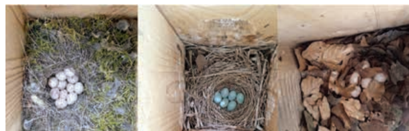
A 2024-ben az erdei madárodúban költő fajok tojásai; balra széncinege ( Parus major ), középen örvös légykapó ( Ficedula albicollis ), és jobbra csuszka ( Sitta europea ) fészkalj

A széncinege mellett az erdőben az odúkat elfoglalják még kék cinegék ( Cyanistes caeruleus ), örvös légykapók ( Ficedula albicollis ) valamint csuszka is ( Sitta europea ). 2024-ben