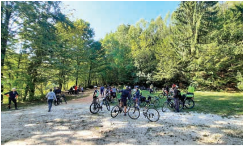
Az Év Erdei Kerékpárútja a Magas-Bakony megismerésére hív

Az OEE által kezdeményezett program célja, hogy a fenntartható erdőgazdálkodást, erdeink ökoszisztéma-szolgáltatásait minél szélesebb körben bemutassa a nagyközönségnek. Továbbá, hogy népszerűsítse az aktív életmódot, emellett pedig biztonságunk és a természet megőrzése érdekében felhívja a figyelmet az erdőben történő kerékpáros kikapcsolódás írott és íratlan szabályaira. Ezzel kapcsolatban az OEE kiadványt is megjelentetett Tudatos Kerékpározás Magyarország Erdeiben címmel, mely ingyenes letölthető az OEE honlapjukról.