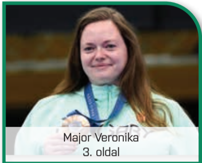
Major Veronika 3. oldal