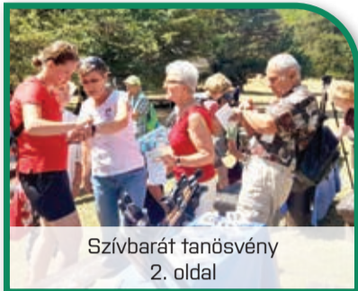
Szívbarát tanósvény 2. oldal