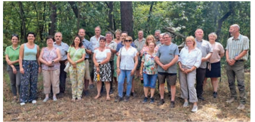
Az erdész-pedagógus párok a Bakonyszentlászlói Erdészettel ismerkedtek