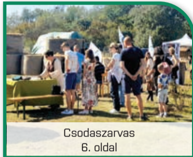
Csodaszarvas 6. oldal