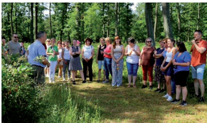
Az erdei környezetben is jól érezték magukat a kollégák

A résztvevők köszönetüket fejezik ki a társaság vezetésének és a balatonfüredi kollégáknak a tartalmas, jó hangulatú kirándulásért.