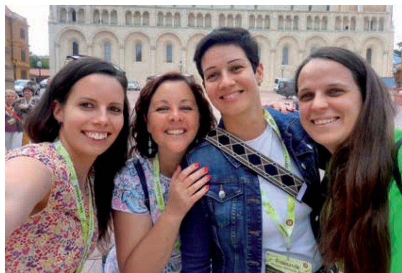
Jó hangulatban a bakonyerdős hölgyek