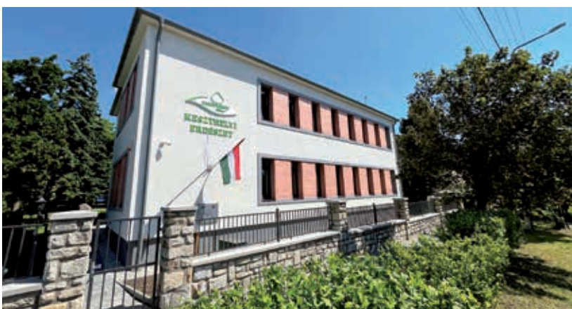
Szemre is tetszetős az erdészeti megújult otthona

A lapostetős építmény korszerűsítése két ütemben történt meg: először az épületenergetikai felújítás valósult meg, majd a meglévő alaprajzi elrendezés újragondolása, kor-