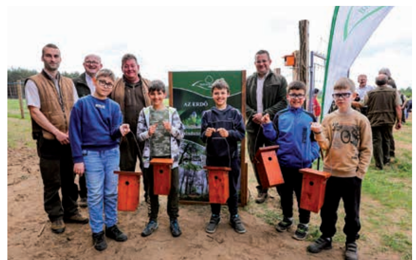
A diákok segítettek a faültetésben és az odúkihelyezésben

Az Energiaügyi Minisztérium (EM) miniszterhelyettese, dr. Koncz Zsófia államtitkár kiemelte, az Újszülöttek Erdejé Programot az Agrárminisztérium irányításával az erdőgazdaságok valósítják meg országsszerte. Zambó Péter erdőért és földügyekért felelős államtitkár kihangsúlyozta, a trianoni békediktátum után az ország erdőszűrsége 11