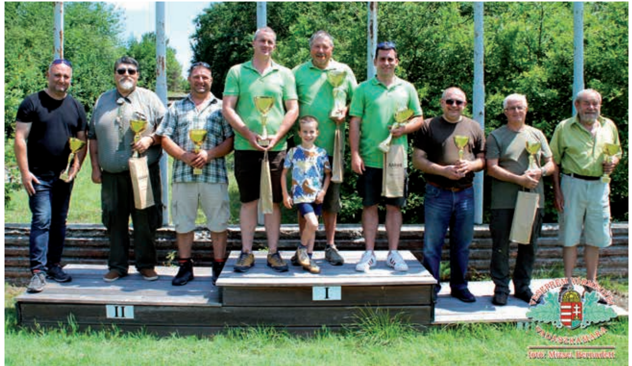
A Vadász kamarai Nagydíjon első helyezett csapat