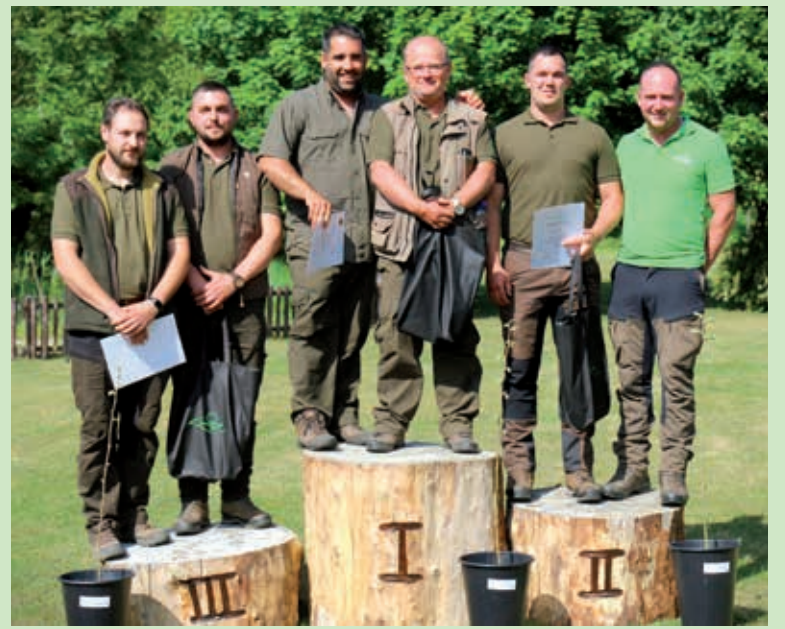
A csapatverseny résztvevői a dobogón. Legfelül a balatonfüredi erdészek