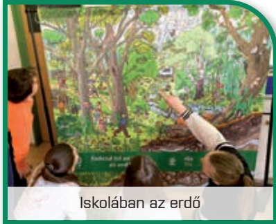
Iskolában az erdő