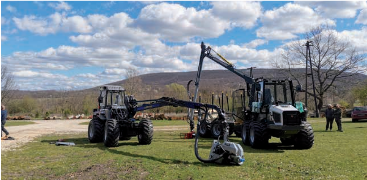
Az erdészeti géppár komoly segítséget jelent a fakitermelési munkálatok során

A Bakonyerdő Zrt. számára a legnagyobb fejtörést továbbra is a leányvállalat okozza. A BEFAG Parkett Kft. a tavalyi évhez képest nem tudott előbbre lépni. 2024 első öt hónapjában 110 ezer négyzetméter parkettát gyártottak és értékesítettek, ami kevés a jó gazdasági teljesítményhez.