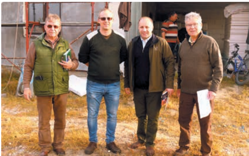
A szürketölgy-makk átvétele. Jól alakul az együttműködés

A jelenlegi földhasználati módokat tekintve Magyarország területének jelentős része ökológiai határhelyzetben helyezkedik el. A társaságunk által kezelt erdőterületen évtizedek óta tapasztaljuk a klímaváltozás szélsőségeinek hatását, az erdőállományokat alkotó egyes fajok lassú-gyors pusztulását. Az agrárklíma-kutatások az előrejelített klímaváltozás hatáselemzése és az alkalmazkodás lehetőségei az erdészeti és az agrárszektorban rámutattak erdeink veszélyeztetettségére, felhívták a figyelmet arra, hogy sürgősen cselekedni kell. A kutatások során rávilágítottak arra, hogy az őshonos fajokot a velük közeli rokonságban lévő melyik potenciálisan szoba jöhető cserefafajokkal lehetne felváltani.