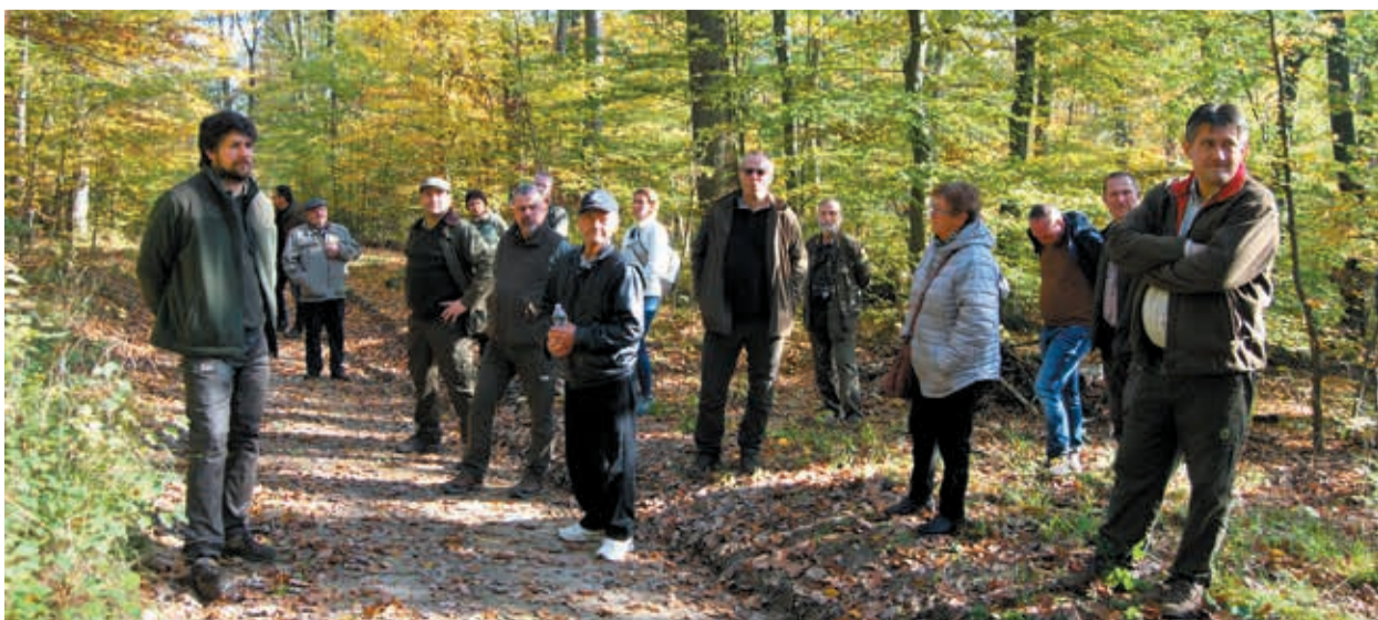
A zömében bükk és tölgy alkotta elegyes erdőben négy mintaponton figyelhettük meg az állományszerkezetet

Két évtizedet felölelő munkájával tevékenyen részt vett a vadászati ágazat szakmai színvonalának emelésében, kultúrájának fejlődésében, valamint hozzájárult a Bakonyerdő Zrt. vadgazdálkodásának javuló megítéléséhez.