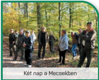
Két nap a Mecsekben