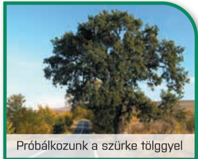
Próbálkozunk a szürke tölgygel

VÁLLALATI ÚJSÁG • 2022. DECEMBER • XLVII. ÉVFOLYAM, 4. SZÁM