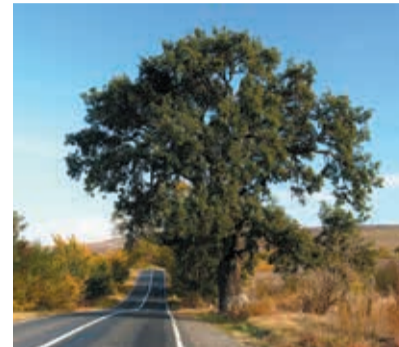
A szürke tölgy ( Q. pedunculiflora ) habitusa szabad állásban

Az utazás első napján, 950 kilométer megtétele után a Nagybaconi Közbirtokossághoz érkeztünk. Immár több éve hozunk be az erdeiből kike-