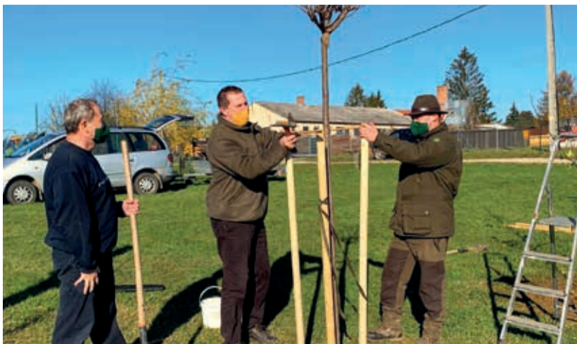
A fásítással a tízezer lélekszámnál kisebb településekre koncentráltak

Az Agrárminisztérium összehangolt fásítási és erdősítési programjainak célja, hogy 2030-ra az ország területének 27 százalékát tegyék ki az erdővel és fával borított térségek.