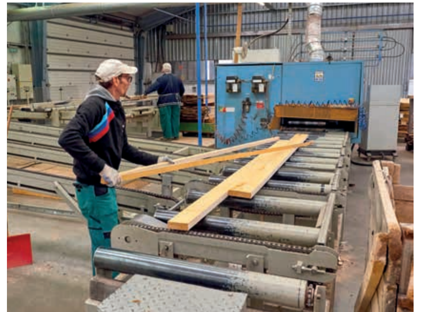
A termékszerkezet racionalizálásától az eredmények javulását várjuk

Egy nyári döntés értelmében a tavalyi nagyságrendben használtuk ki a cafetéria keretet. Most úgy látjuk, a tulajdonos által elvárt eredményt teljesítve a szellemi és fizikai dolgozók részére bérkiegészítést is tudunk még karácsony előtt fizetni.