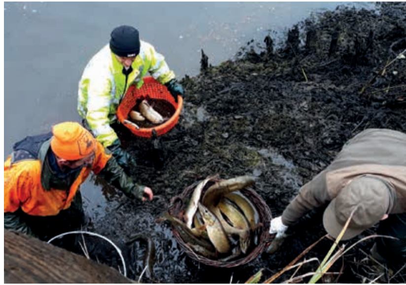
A lehalászott csukák a karácsonyi asztalra kerülnek

A halállomány felméréseinek eredménye nagyjából egybeesett az előzetes várakozásokkal. A tavak jelentős csukaállománnyal rendelkeztek, ebből a halfajból több mint hat mázsa került partra. Mindhárom tóban szép számmal láttunk csukaivadékokat, emellett elegendő mennyiségű, táplálékul szolgáló apróhal is rendelkezés-