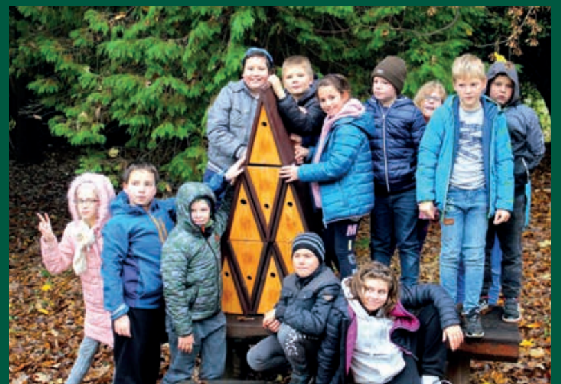
Elsőként a Bakonyi Kisbetyár Erdészeti Erdei Iskolában kerültek ki madárodúk

Mindegyik odút egy-egy gyermek örökre fogadhatta, és névre szólóan kerültek ki a helyükre.