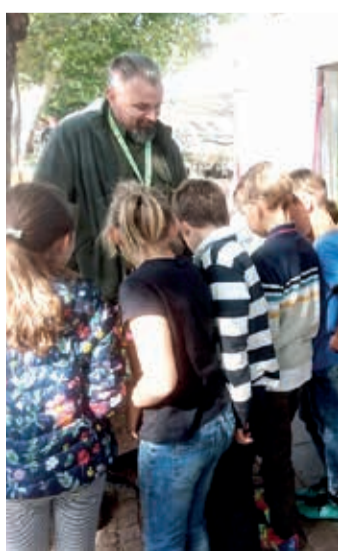
Huszonkét erdőgazdaság vett részt a programon

Az érdeklődők megismerkedhettek az erdészek munkájával, a fenntartható környezet érdekében végzett erdőgazdálkodással és az ahhoz szorosan kapcsolódó oktató-nevelő munka mindennapjaival.