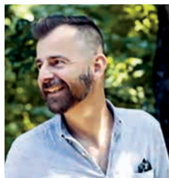
A Bakonyba Grecsó Krisztián kortárs magyar író látogatott el

Kortárs magyar író volt a meglepetésvendég