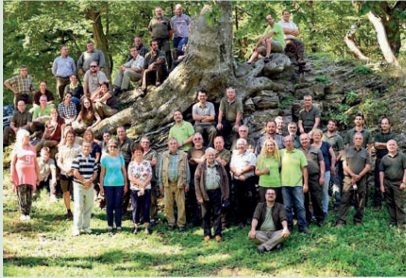
Tartalmas, szakmai és kulturális élményekben gazdag nap volt

Második állomásunk a közel-múltban felújított Óház kilátó volt.