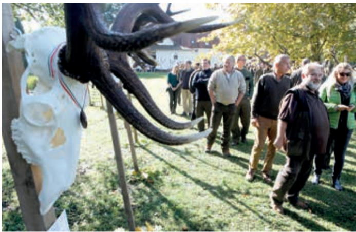
A Bakonyerdő területén 150 vendégvadász 141 szarvasbikát ejtett el

„Természet. Egy csodálatos dolog. Nem beszél, ezért soha nem hazudik. Nem ígér, mégis mindent odaad magából. Nem szól, mégis többet elmond annál, mint amit ember valaha elmondhatott.” – idézte a Tüskevából Fekete István szavait Varga László. A Bakonyerdő Zrt. vezérigazgatója szerint ezek a szavak elmondják a természetnek azt a szépségét, amiben a magyar erdő- és vadgazdálkodásban dolgozók nap mint nap végezhetik a tevékenységü-