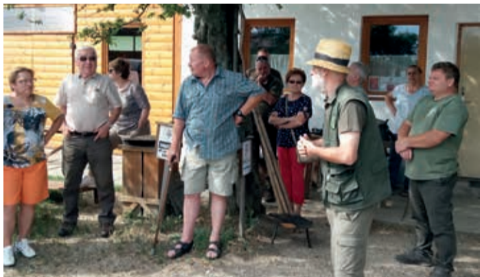
Tartalmas programot biztosított a Pápai Erdészet

Az Országos Erdészeti Egyesület Pápai Helyi Csoportja és a Bakonyerdő Zrt. Pápai Erdészete júliusban rendezte meg az erdész-pedagógus párok XII. találkozóját, aminek a Pápai Erdészet adott otthont.