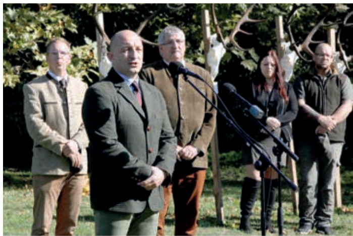
Takács Szabolcs kormány megbízott a vadászati hagyományok ápolásáért is gratulált a Bakonyerdő Zrt.-nek

A kormány megbízott elmondta: fontos, hogy a hazai fizető vendégek száma megnőtt, a szűk keresztmetszetet ezúttal külföldiek jelentették. Idén összesen 551 trófeát hoztak be a megyéből a hivatalhoz, a trófeák méretét tekintve pedig kiemelkedőbb volt a tavalynál.