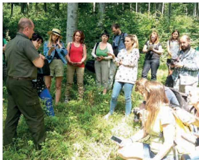
Idén a sajtó számára szervezett nyílt nap házigazdája is a bakonyi vándortábor volt

A programok sorát színesítette az OEE kezdeményezése, amelyben neves