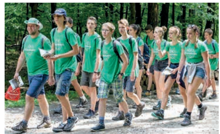
Nyáron közel négyezer gyermek és kísérőtanár járta végig az eddig meglévő öt útvonalat

különböző média képviselőiben megjelent újságíró, rádiós részére bemutattuk a vándortábor útvonalát, a huszárokélpusztai és a hubertlaki táborhelyet, a programokat, a vándortáborozás varázsát. A Kőrös-hegyen találkoztak az egyik vándortáboros csoporttal, beszélgettek a gyerekekkel és számos riportot készítettek. A sajtó munkatársai mindeközben betekintést nyerhettek a Bakonyerdő Zrt. által folytatott természetközeli erdőgazdálkodás rejtelmeibe