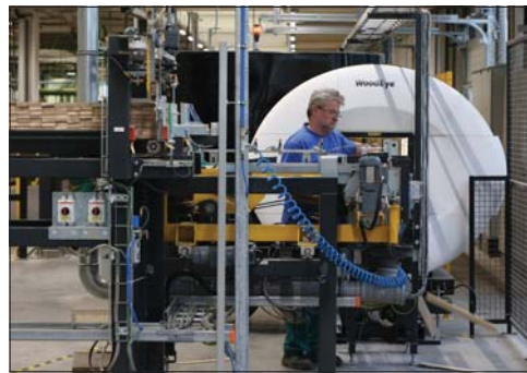
A teljes gyártósor hossza csaknem 95 méter