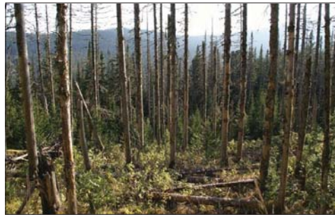
Ugyanakkor a szibériai erdőkben óriási károk okoz