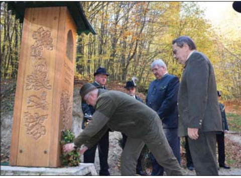
Az alapítók megkoszorúzták az emlékművet