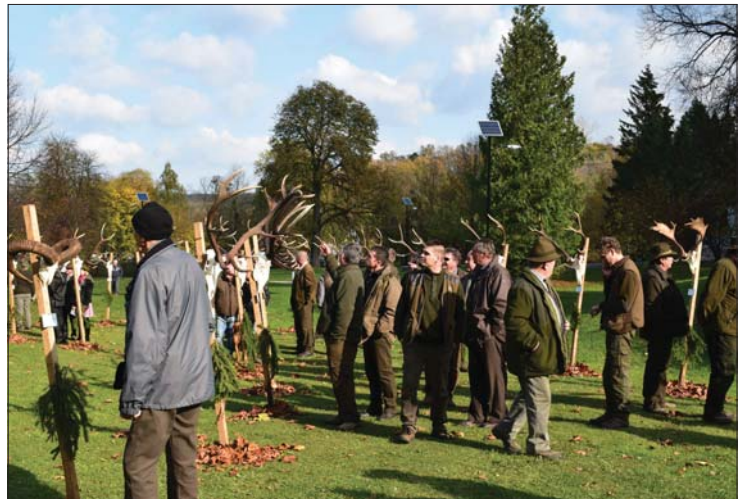
A jó hangulatú eseményen volt lehetőség a szakmai eszmecserére is. Jövőre ismét megtartják

A trőfeaszemle arra is jó volt, hogy a vadászok folytassanak szakmai eszmecserét követően egymással.