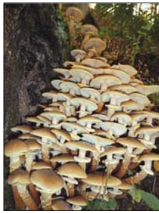
A tuskógomba szemre tetszetős...

Egyelőre nehéz felmérni, mekkora problémát jelent erdeinkben a tuskógomba, hiszen számos esetben kívülről nincsenek látható jelei a károkozásnak. Ugyanakkor kivágott fatörzseknel nagyon gyakran lehet látni a gomba által okozott fehér rothadást a fa belsejében.