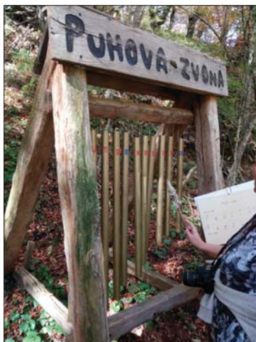
A hangos tanösvény egyik állomása. A tanösvény különlegessége, hogy az erdő, az élővilág hangjait szimbolizáló interaktív állomás (balra). A Kornati Nemzeti Park (jobbra)

A Vrbovsko-katlan közepén a Dobra mellett valamikori nagy deszkagyár maradványai láthatóak, amelyek különös történetet mesélnek a történelemtől és kiegészítik az egész szurdok képét.