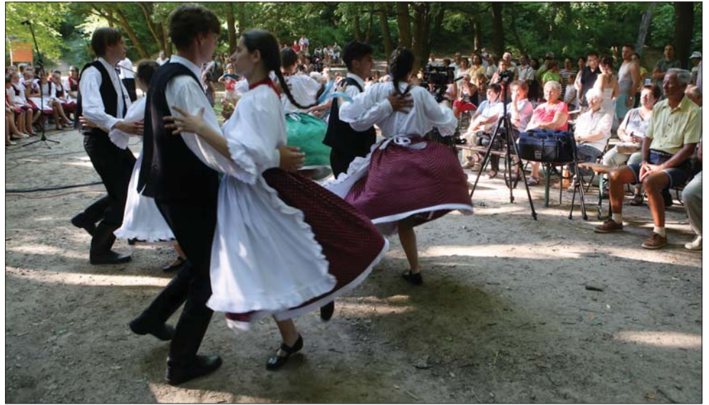
A balatonfürediek és a környékeliek számára népszerű kirándulóhely a Koloska-völgy, a város több programot is szervez ide. A közeljövőben megújul a kirándulóerdő

Közjóléti beruházásra nyert támogatást a vállalat