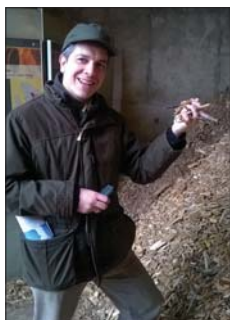
A nurmesi KME Oy 4 megawattos erőműve

korán az ipari célú faanyagot maximum 200 kilométeres, az energetikai célú faanyagot pedig maximum 100 kilométeres távolságig szállítják el. A hatékonyságot nagyban tudja növelni a régió fejlett és nagy teherbírási úthálózata, amely lehetővé teszi a 76 tonna össz-gördülő tömegű alapanyag-szállítást is. A nap második részében Finnország legismertebb természetvédelmi területére, a Koli Nemzeti Parkba tettünk egy rövid kirándulást.