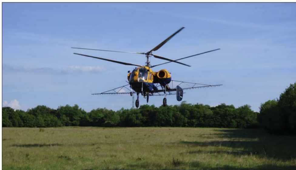
A bemutatott technológia a helikopterrel egyben nem hétköznapi látványosság a felszállóhelyhez közeli lakosoknak

Az idősebb kollégák által megszokott gyakorlatként végzett „nabuzás” volt a legeredményesebb módja a siskanád visszasszorításának, elsősorban tölgy, illetve cser erdősétek esetében. A több erdészeti alkalmazott ápolási mód része volt a gondos tervezés, előkészítés mellett a soha felvett nem érőnek tűnő várakozás a helikopterrel, hol időjárási okok, hol műszaki problémák miatt.