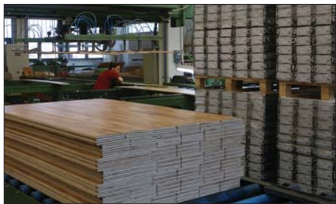
A parkettagyár további korszerűsítése elengedhetetlen

Eddig a raklaptól kezdve a keféfán keresztül nagyon sok mindent készítették a gyárban. Van azonban egy olyan pont, ameddig még érdemes feldolgozni a faanyagot, tovább viszont már nem. A parkettagyárban a folyamatban lévő beruházások jobb megvalósításáért is együtt dolgoznak. A fedőréteg-beruházás folyamatban van, a gépeket megrendelték, egy részük már a helyszínen szerelik. A csarnokon a beruházáshoz szükséges építészeti, épületgépészeti átalakításokat elvégezték.