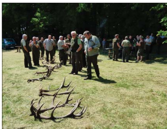
Vendéglátóink hullott agancsok bemutatójával is készültek Szentpéterföldön

Egy kis frissítő után folytattunk a következő program-ponthoz, ami Páka község határában volt, ahol is egy hideghárbos bunkerrendszert néztünk meg. Az úgynevezett bunkerturizmus az utóbbi években alakult ki Dél-Zalában, az egykori jugoszláv határ mentén az 1950-es