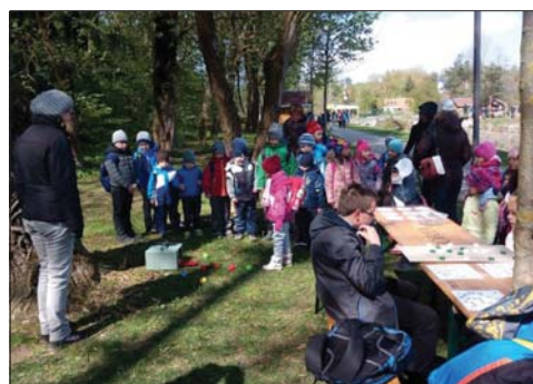
Áprilisban a Fenntarthatóság MindenKOR kétnapos rendezvényen játékos foglalkozások vártak az érdeklődőket

Idén tavasszal is számos rendezvényvel készült a Természet Háza, ezek a zöld jeles napok köré (a víz világnapja, Föld napja, madarak és fák napja) szerveződtek. Az osztálykirándulások időszakában sok csoportot fogadtak, távolabbról, de a környező településekről is többen ide szervezték a tanulmányi útjukat.