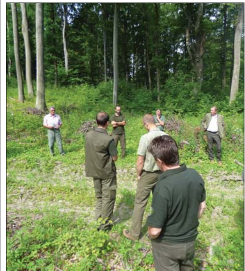
Vendégeink bükkféléjűtást is megtekinthettek a bazaltregióban

A jelen közjóléti célú beruházásai közül elsőként a Gyenesdiáson 2014-ben létesült Természet Ház, majd a már Keszthelyen fekvő Fesztettés Imre Állatkertot néztük meg, osztatlan elismerést aratva. (Közjó: építő ügy, tett, dolog, amely egy – nagyobb – közösség vagy az egész társadalom életét javítja, előre-