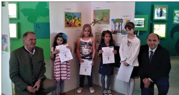
A díjazottak különböző értékű ajándékutalványt és oklevelet vehettek át