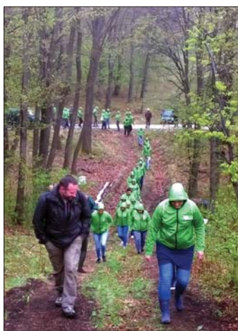
Százezer csemetét ültetnek a Keszthelyi-hegység azon területeire, amelyek kipusztultak

Az erdőfelújítás óriási feladatok elé állítja a Keszthelyi Erdészeti, ezért örömmel vették a WWF Magyarország megkeresé-