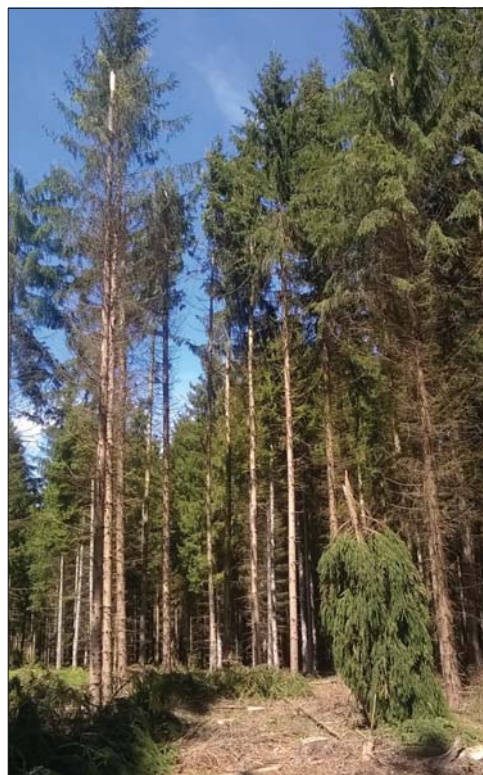
Fakidőlések, koronatorések keletkeztek, fiatal állományok dőltek meg