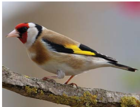
A tengelic kontinensünk legutóbbi madarainak egyike

A fiatalok finoman szavozott, sűrűsfehér fejről egyaránt hiányzik a fekete, a piros és a fehér szín is, a fajra jellemző sárga-fe-