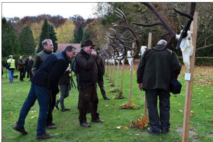
A megyei rekord gimkikát szintén megnézheték a trófeaszemle résztvevői