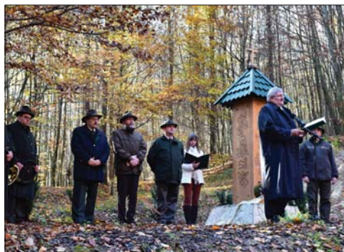
Hagyománnyá vált a hivatásos vadászok hubertlaki ünnepsége