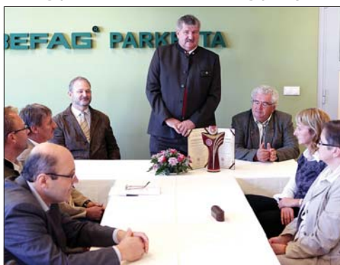
A Magyar Termék Nagydíj híven jelzi az üzem piaci megtéltetését

A díjnyertes készpárketta antibakteriális bevonattal készül, amely kitűnő a fertőzésveszélynek kitett felületek hatékony, költségkímélő, az egészségre ártalmatlan, környezetbarát fertőtlenítésére. A nanotechnológiai eljárásnak köszönhetően ezüstionokat tartalmazó kerámiareszecskéket építünk be a Befag készpárketta fe-