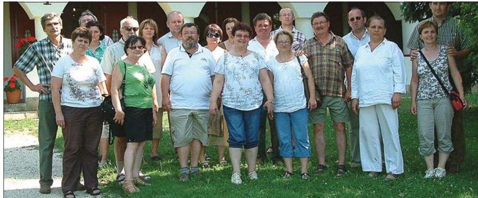
Ebben a rohanó világban érdemes volt megállni, erőt meríteni, személyesen megismerni egymást, bemutatni a cég jövővi elképzeléseit

A huszárokelőpusztai komplexumban bemutatkozott az újonnan nyílt Bakonyi Kisbetyár Erdészeti Erdei Iskola, végül a tartalmas napot egy jó ebéddel, baráti beszélgetéssel fejeztük be.