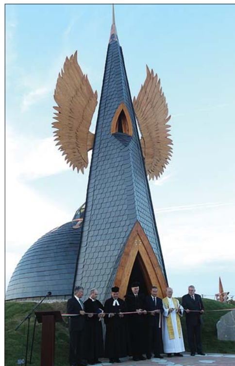
Makovecz Imre koncepciója nyomot hagyott Devecserben

A vörösiszap-katasztrófa második évfordulóján kisebb csoda szemanthú lehetnek azok, akik ezen a napon Devecserben jártak. A rendkívül széles körű, az egész országot megmozgató összefogás eredményeként új időszámítás s ezzel együtt új élet köszöntött a városra.