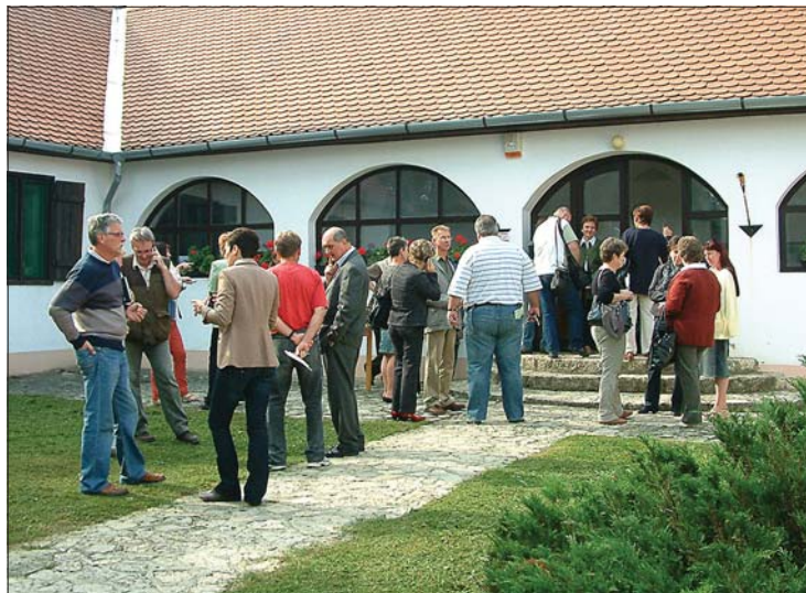
A meghívást elfogadva sokan tiszteletüket tették Huszárokelőpusztán. Tovább bővült az oktatási paletta

Az előadás után, kötetlen beszélgetés közben a vendégekkel bejártuk az iskola épületét, a körülötte elterülő négyhektáros parkot, ahol megtekintettük a Szechenyi Zsigmond-emlékházat, a szabadidős programok helyszínül szolgáló sportpályát, kültéri játszótérrel. A rönkbütorokkal, tűzrakó hellyel, madárodúkkal felszerelt park számos élményt nyújthat az ide látogatóknak. A helyszínen működő konyha finom