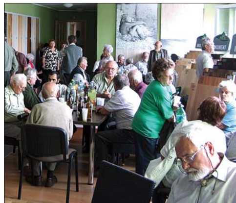
Jó volt találkozni az egykori kollégákkal. Felidéztek emlékeiket

Régen nem látott tömeg gyűlt össze Keszthelyen, ahol idős kollégáink vitatták meg egymással az elmúlt hónapok történéseit. Ezúttal a Keszthelyi Erdészet volt a házigazdája a hagyományos nyugdíjas-találkozónak.