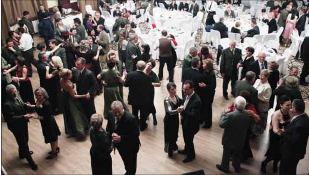
A nagy érdeklődés mellett zajló bálón a hangulatra, a műsorra, az étkekre nem lehetett panasz

A megyei vadászkamara és a megye két állami erdőgazdasága összefogásával, februárban nívós körülmények között rendezték meg az első megyei erdősz-vadász bált.