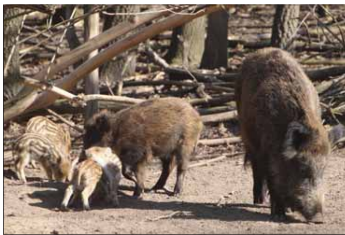
A kiváló makktermés jótékony hatással volt a szaporulatra is

A tél folyamán 54 fizető hajtást szerveztek vendégeik részére, ezeken összesen ezer nagyvad került terítékre, aminek a fele vaddisznó volt. A korábbi években is hasonló mennyiségű nagyvad-terelővadászatot tartottak. A kilótt vaddisznók száma ugyan csökkent, ugyanakkor az egy alkalomra jutó terítékszám jóval nagyobb