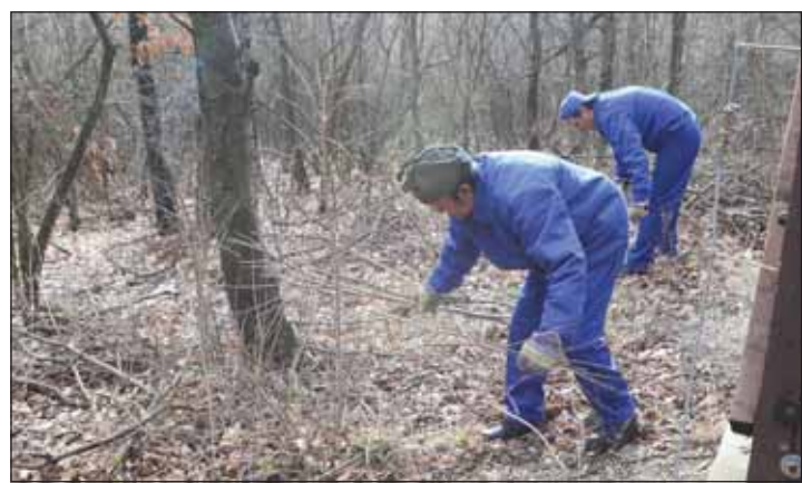
A program keretében mindegyik erdészetenél közhasznú, közcélt szolgáló, zömében közjóléti és erdőművelési munkákat végeznek

Az év során többek között az erdészek szakirányítása mellett elsősorban parlagfű és más gyomnövények irtását, illegális hulladéklerakók megszüntetését, erdészeti sétatutak és tanösvények, valamint közjóléti eszközök karbantartását végzik. Ezenkívül különösebb szaktudást nem igénylő munkák, mint a turistautak tisztítása, az átérselek javítása, a határjelek és a tűzpászták karbantartása is a közmunkások feladata lesz. A program része a Veszprém