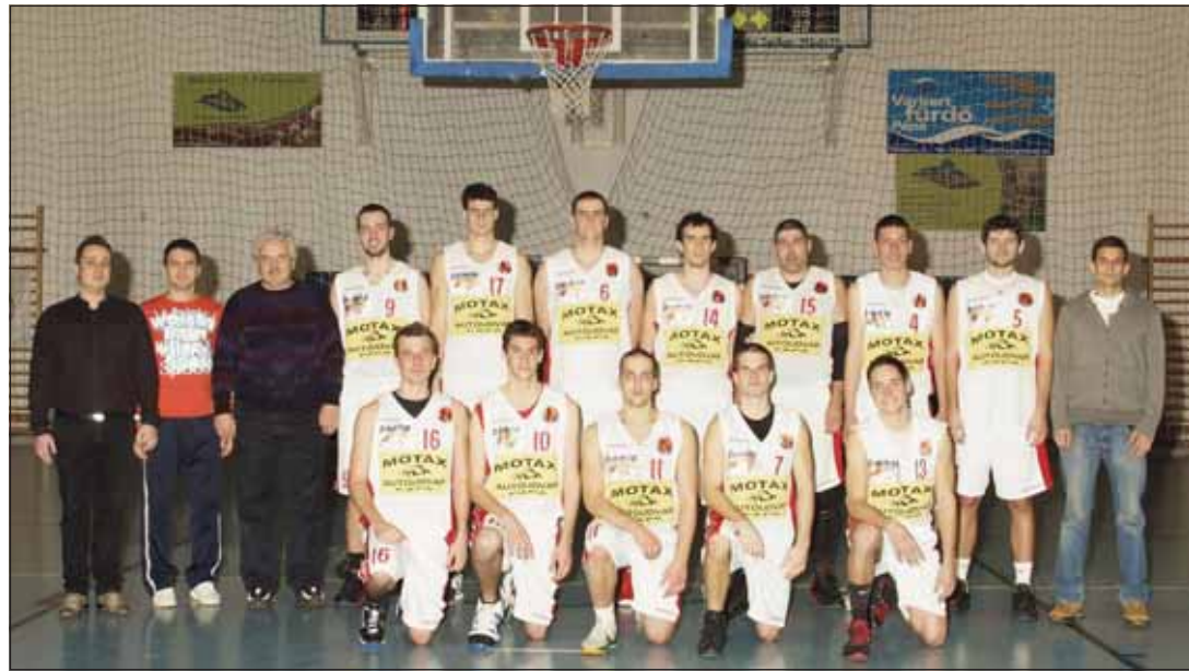
A Motax Autó Pápa Kosárlabda Club csapata. Nagy célokat tűztek maguk elé a bajnokságban

Előzetesen talán a Motax Autó Pápa KC legoptimistább szurkolói sem számítottak arra, miszerint kedvenceik ilyen parádésan szerepelnek majd a zajló NB II-es férfi kosárlabda-bajnokság nyugati csoportjában. Az NB I/B-s sorozattól az idény előtt – kényszerből – elkészülő, a mezőny legtöbb saját nevelésű játékosát adó együttes jelenleg úgy „horgonyoz” a tabella harmadik helyén, hogy a kiírásban éppen annyi pontot hullajtottak, mint a listavezető szombathelyiek.