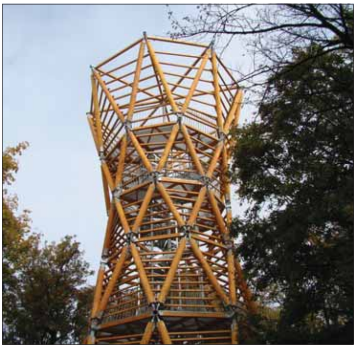
A turisták és a helyiek régi álma vált valóra a kilátó felújításával

A közelmúltban adták át a 2011-ben teljesen újjáépített Kisfaludy kilátót, mely a Bakonyerdő Zrt. Monostorapáti Erdészeti területén, a badacsonyi kirándulóerdőben található.