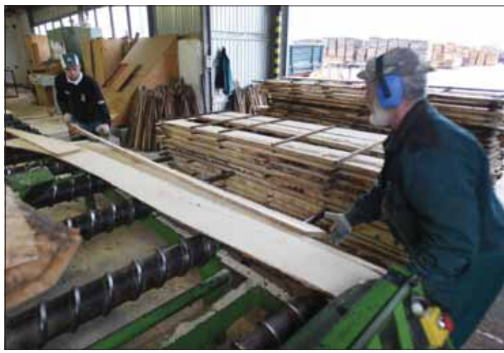
Tavaly 1,16 milliárd forint volt a megvalósult beruházás, amit szinte kizárólag saját erőből hajtott végre a társaság

A társasággal szemben a nehéz gazdasági helyzet közepette is alapvető követelményként fogalmazódik meg a működőképesség fenntartása, a foglalkoztatottság szinten tartása, valamint a nyereséges gazdálkodás, a folyamatos likviditás biztosítása. Mindezeket Varga László vezérigazgató előzetesen fogalmazta meg, mielőtt a tavalyi év eredményeiről, az idei év feladatairól beszélgettünk volna. A romló gazdasági környezet ellenére a Bakonyerdő Zrt. 2011-ben 8,5 milliárd forintot meghaladó árbevétellel zárta az évet, ami jelentős fegyvertény. Az alaptevékenységekből származó árbevételek felül jelentős tétel volt a deveszeri kárelhárítás, helyreállítás során végzett munkából származó bevétel is. A tavalyi éves adatokhoz képest a bevételek alakul-