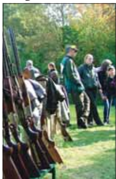
A gyenesdiási létesítmény Közép-Európa egyik legszebb lötere, ami nyáron a nagyközönség előtt is nyitva áll

Noha régóta vallják: sportáguk nem csak a fegyverekről szól – hanem a kitarásról, az állóképességről is –, kétszázhusz hazai lövészműhely éves ponttáblázatán tavaly is dobogón zártak, harmadikak lettek; jelezvén, náluk a minőség sportlövészet van fókuszban. A BEFAG Keszthelyi Erdész Lövészklub tagjai az előző évadban félszáz érmet nyertek a korosztályos országos bajnokságokon.