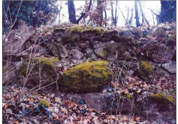
A várkok északi oldalán készült a kép, amely a falazás sajátosságát mutatja. Jellemző, hogy igen nagy méretű, durván faragott bazalttufa kőanyagból készült a fal külső síkja. Feltűnő, hogy a falazat belsejében is nagyméretű kővek találhatók, és igen nagy a habarcs szilárdsága

Az óvár helyreállítási és fejlesztési munkálatai nettó 7,4 millió forintba kerülnek. A szükséges pénzforrást a Nemzeti Kulturális Alaphoz benyújtott pályázatból és a pályázati önerőből kívánjuk biztosítani. A várrom a Szigligeti-félszigeten található, a hely csodálatos kilátást biztosít a Balatonra, illetve