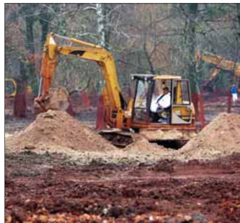
A devecseri kastélypark helyreállításában szerepet vállalnánk

A Devecseri Városüzemeltetési Kht.-vel közösen reménykedünk abban, hogy rövidesen meg-