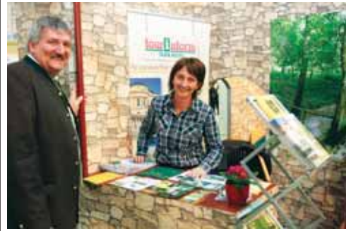
Ide jönnek a kiállítások, amelyeken részt vettünk