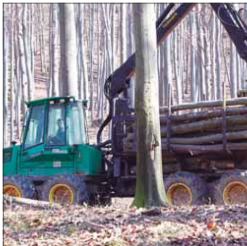
Az idei évben nettó 251,5 ezer köbméter a fakitermelési alapterv

Ha az árbevételén belül az egyes ágazatok arányát nézzük, akkor azt látjuk, hogy az erdőgaz-