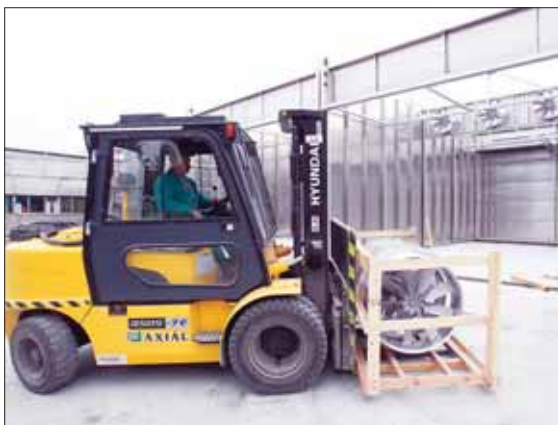
A szárítóberuházás a finisbé érkezett, április elején már működni kell

épületet, aminek a tervezése már elkezdődött. A következő lépés az engedélyeztetési eljárás Ezzel párhuzamosan pályázati lehetőséget keresünk, amely segíteni tudja a 600 millió forintos beruházás megvalósítását. A gépsorra több helyről is kérték árajánlatot, ezek átvizsgálása után döntés legkorábban április végén születethet. A gépek év végén, a jövő év elején állhatnak üzembe.