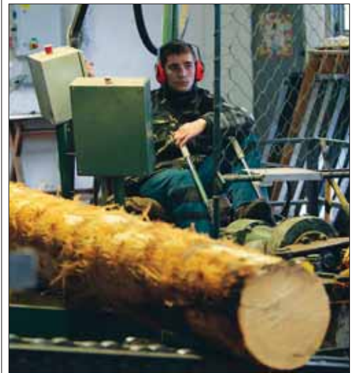
A válság idején hozott intézkedések eredményeként a franciavágási fűrészüzem hatékonysága, termelékenysége egyaránt emelkedett

– Sok új dolgot szeretnék megvalósítani, amiket máshol már kipróbáltak. A Bakonyerdő infrastruktúrájának (erdei útjainak) a rendbetételét nagyon fontos feladatnak szánom. Ezzel kapcsolatban napokon belül bemutatott tartunk az erdészeteknek, hogy megismerhessék az ehhez szükséges technikát, technológiát. Fel kell készülni azokra a kihívásokra, melyekkel az erdőgazdaságok néhány év múlva szembeülnek fognak – jelesül a munkabérek emelkedésének miatt, hogy bizonyos feladatokat már csak gépekkel lehet elvégezni. Nagyon fontos célnak tartom a zalahalapi fejlesztés tisztességes lebonyolítását, ami nagyon komoly feladattal lesz. Minden egyes munkához következetesen ajánlatokat kell bekérni, enélkül megrendelést nem nagyon tudok elképzelni! A legkedvezőbb ajánlat kiválasztása elemi érdekünk.