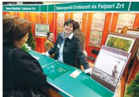
Az MFB-hez tartozó állami erdőgazdaságok együtt mutatkoztak be

Az állami erdőgazdaságok egy-séges arcuattal, egy standon mutatkoztak be a nagyközönségnek a 18. FeHoVán, ahonnan a Bakonyerdő Zrt. sem hiányozhatott.